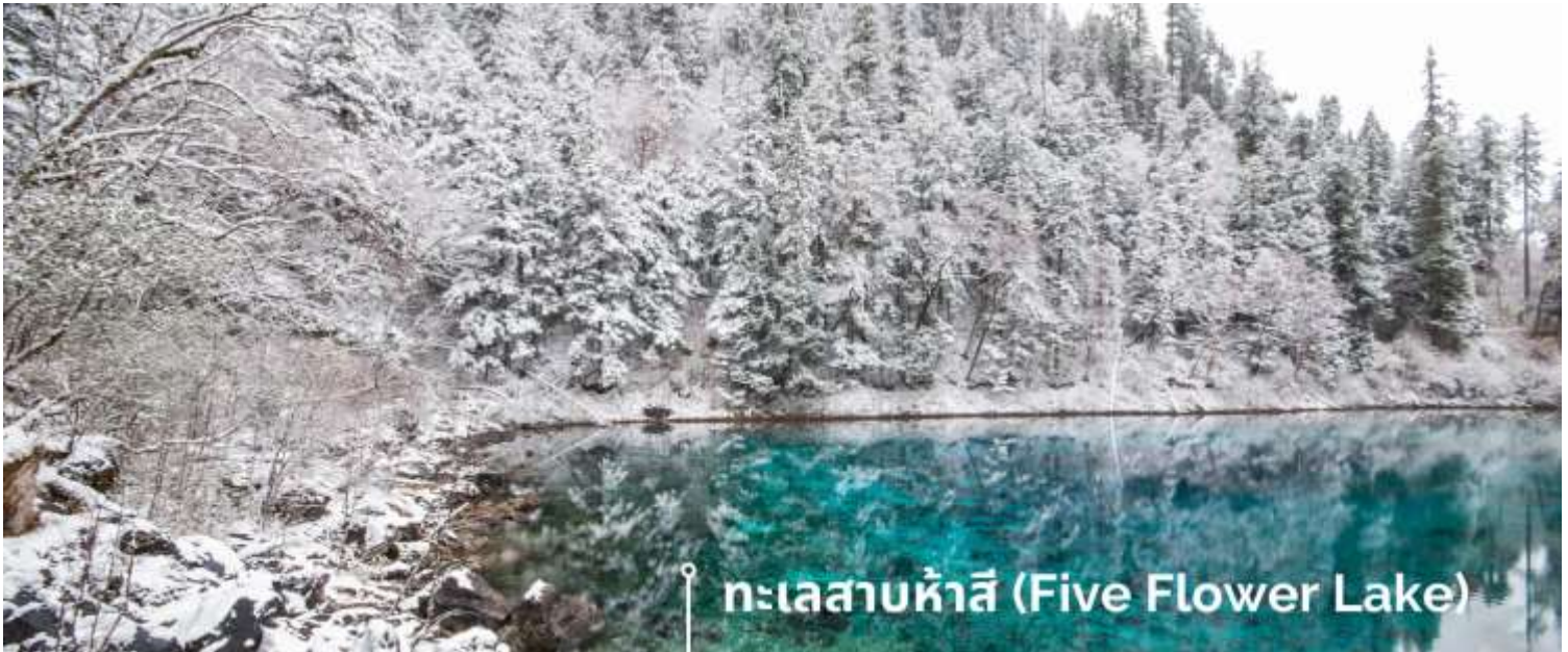
ทะเลสาบห้าสี (Five Flower Lake)

หนึ่งในจุดที่สวยงามและนักท่องเที่ยวแห่มาเยี่ยมชมเยอะที่สุด ตั้งอยู่ที่ความสูงเหนือระดับน้ำทะเลประมาณ 2,472 เมตร น้ำลึกประมาณ 5 เมตร น้ำใสจนเห็นพื้นด้านล่างของทะเลสาบ สีของผิวน้ำสวยงามแปลกตา โดยเฉพาะเมื่อยามแสงอาทิตย์สาดส่องกระทบผิวน้ำ สีของน้ำในทะเลสาบจะสะท้อนเป็นสีส้มถึง 5 เฉดสี สวยงามสะกดตา ซึ่งสาเหตุที่ทำให้เกิดสีสันต่างๆ นี้มาจากการสะสมของแร่ธาตุ และพืชน้ำชนิดต่างๆ โดยจะมีสีสันแตกต่างกันไปตามฤดูกาลและ