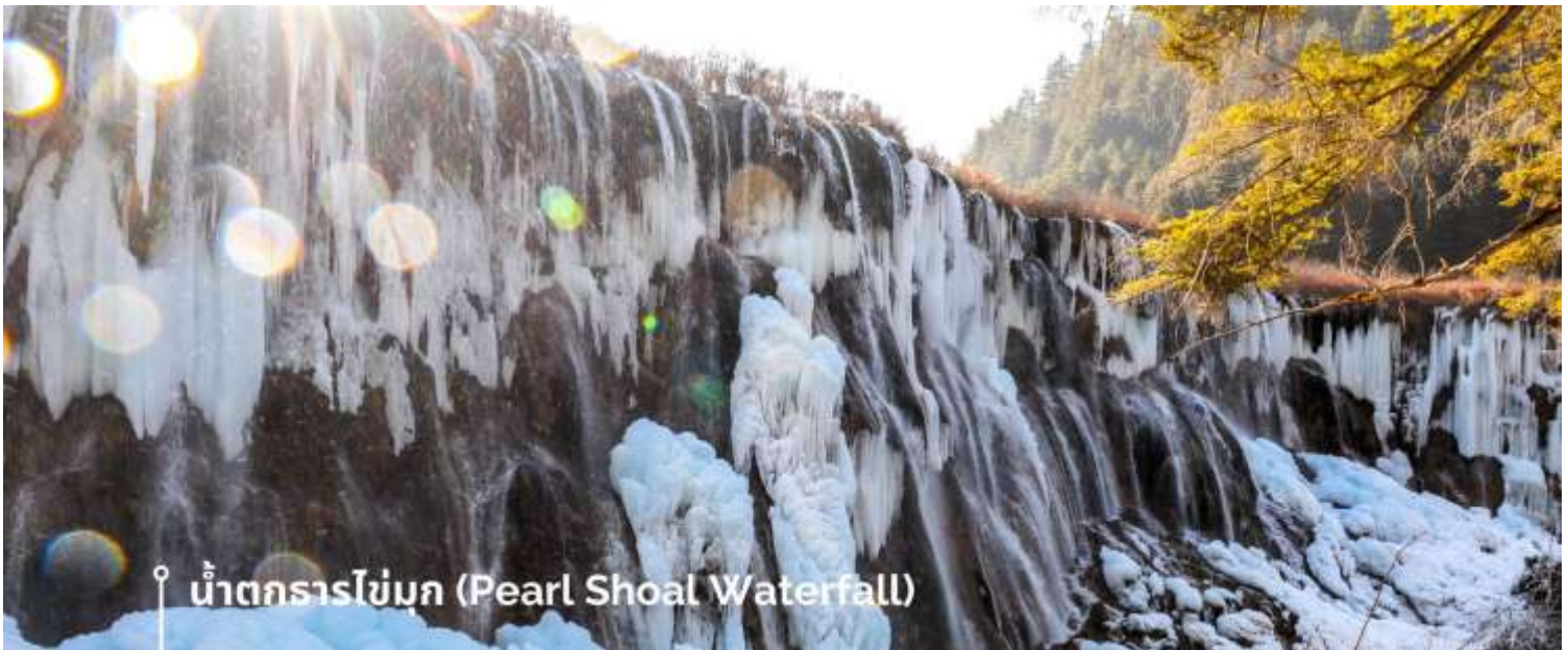
น้ำตกธารไข่มุก (Pearl Shoal Waterfall)

หรือ น้ำตกบูริออลาง (Nuo Ri Lang Waterfall) ถือเป็นน้ำตกที่ใหญ่ที่สุดในจิวจ้ายโกว มีความสูง 40 เมตร กว้าง 310