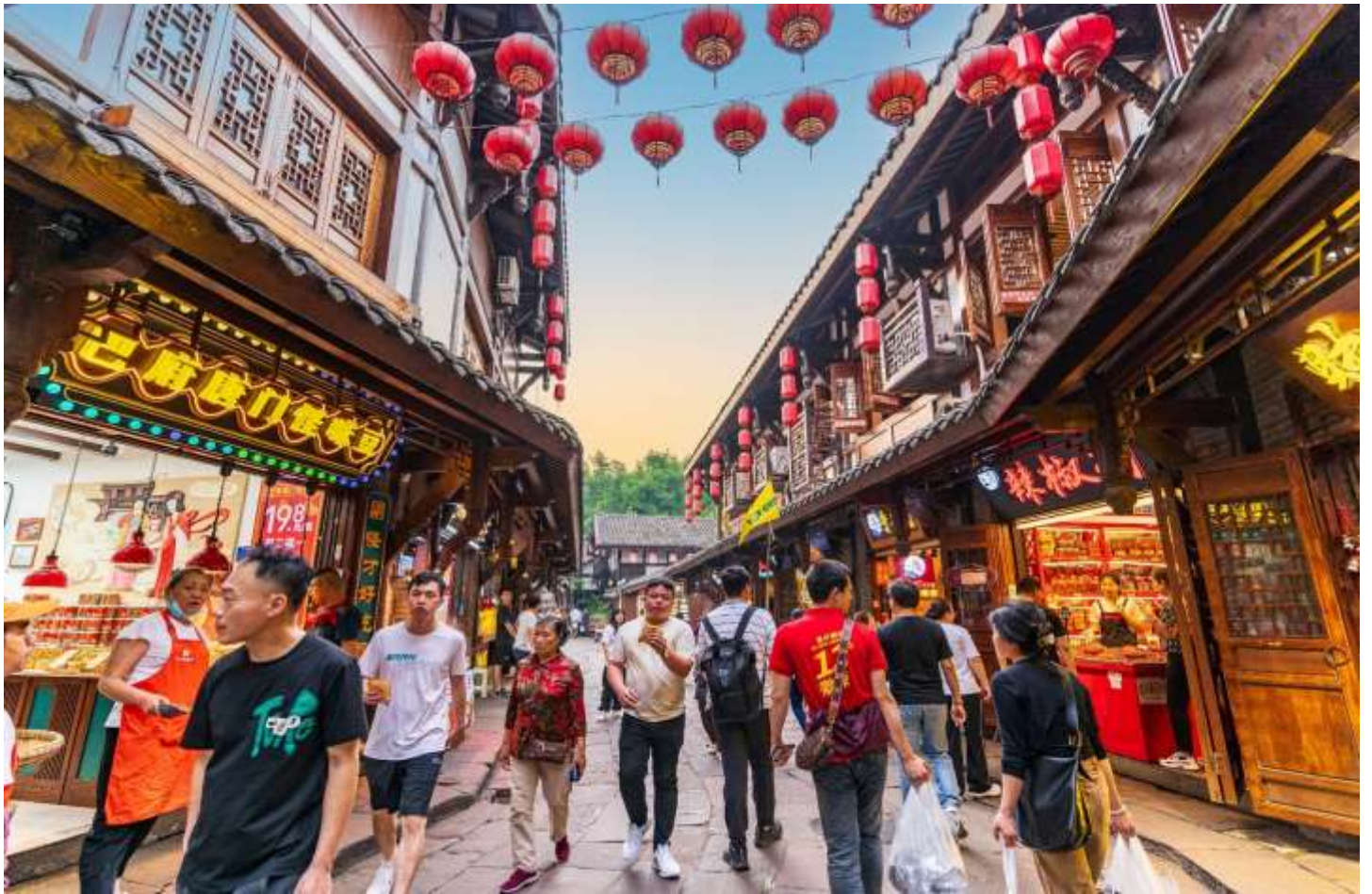
เที่ยง รับประทานอาหารเที่ยง ณ ร้านอาหาร