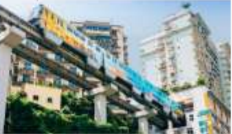
รถไฟฟ้าทะเลตุ๊ก

*ทางบริษัทฯ ขอสงวนสิทธิ์ในการสลับโปรแกรมทัวร์ตามความเหมาะสมขึ้นอยู่กับสถานการณ์ปัจจุบัน โดยคำนึงถึงผลประโยชน์ของลูกค้าเป็นหลัก