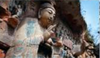
ผาคินแกะสลักต้าจู้ เขาเป่าตึงซาน