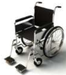
การรับการดูแลเป็นพิเศษ

กรณีผู้เดินทางต้องการความช่วยเหลือเป็นพิเศษ อาทิเช่น การใช้วีลแชร์ กรุณาแจ้งบริษัทฯ อย่างน้อย 7 วันก่อนการเดินทาง มิฉะนั้นบริษัทฯ จะไม่สามารถจัดการล่วงหน้าได้ เนื่องจากการขอวีลแชร์ในสนามบินนั้น ต้องมีขั้นตอนในการขอล่วงหน้า และบางสายการบินอาจมีการเรียกเก็บค่าใช้จ่ายทั้งทางสนามบินในไทยและในต่างประเทศ ซึ่งผู้เดินทางสามารถสอบถามกับเจ้าหน้าที่ได้โดยตรงก่อนทำการจอง และหากในคณะของท่านมีผู้ต้องการดูแลพิเศษ เช่น ผู้ที่นั่งรถเข็น (Wheelchair), เด็ก, ผู้สูงอายุและผู้ที่มีโรคประจำตัวหรือไม่สะดวกในการเดินทางท่องเที่ยวในระยะเวลาเกินกว่า 4 - 5 ชั่วโมงติดต่อกัน ท่านและครอบครัวต้องให้การดูแลสมาชิกภายในครอบครัวของตนเอง เนื่องจากการเดินทางเป็นหมู่คณะ หัวหน้าทัวร์มีความจำเป็นต้องดูแลคณะทัวร์ทั้งหมด