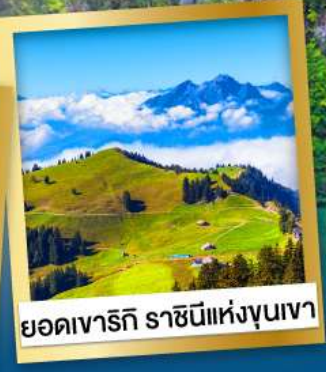
ยอดเขารักิ ราชนิแห่งขุนเขา