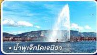
• น้ำพุเจ็ทโคเจนิวา