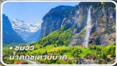
• ชมวิว น้ำตกเซาบัค

กับรถไฟด่วนขบวนสวรรค์ เซอร์แมท-อันเดอร์แมท