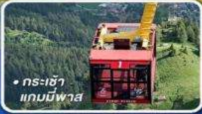
• กระเช้า แกมมีพาส