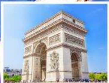
ประตูชัยปารีส