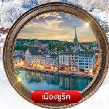
เมืองซูริก