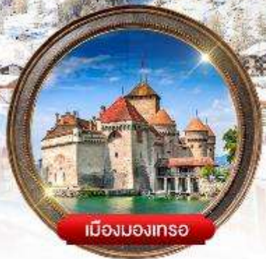
เมืองมอเทอ