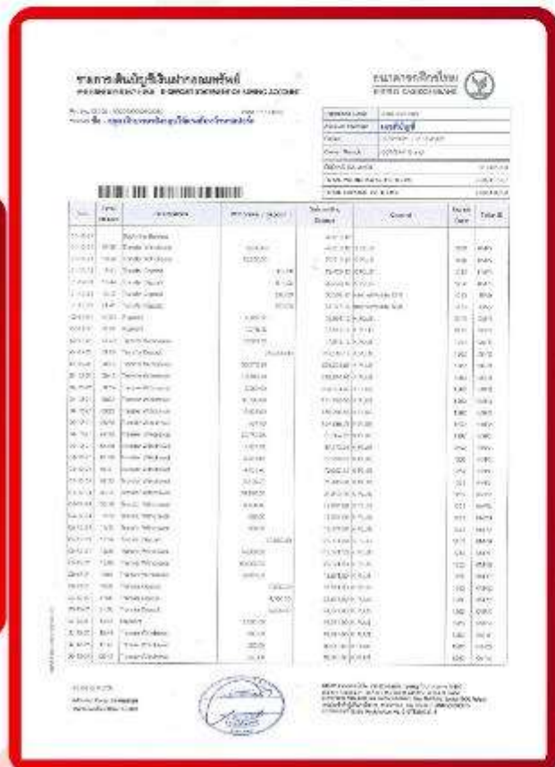
ตัวอย่าง Bank Statement ที่ผู้สมัครต้องขอจากธนาคาร

3.3 ปรับสมุดบัญชีธนาคารตัวจริง และเตรียมไปในวันที่ยื่นวีซ่า