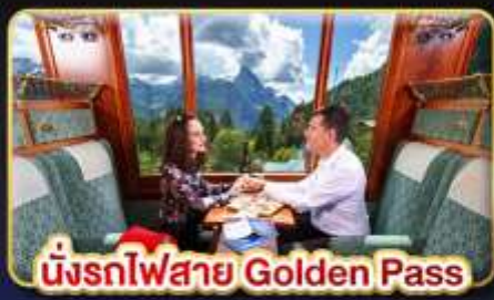
นั่งรถไฟสาย Golden Pass