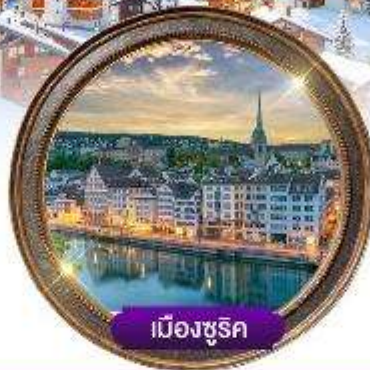
เมืองซูริค