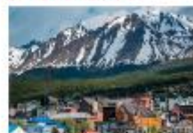
เมืองเอลคาลาฟาเต

** พักที่ Xelena Hotel 4* หรือเทียบเท่า **