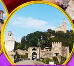
ป้อมชาเรเวทส์