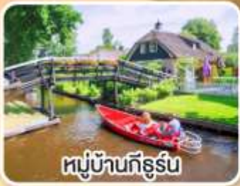
หมู่บ้านทึร์น