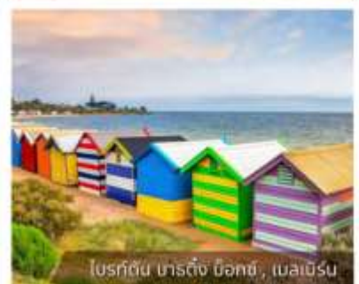
โบสถ์ต้น นาร์ดีง บิชอป, เมลเบิร์น