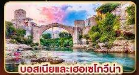
บอสเนียและเฮอร์เซโกวีนา