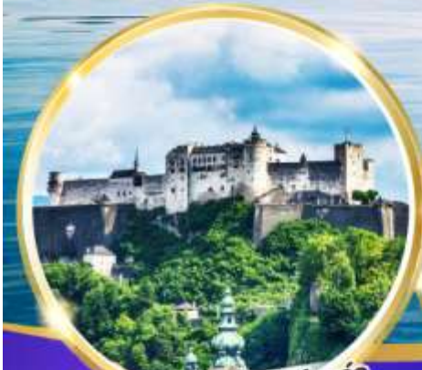
ปราสาทไฮเซนซาลส์บวร์ก