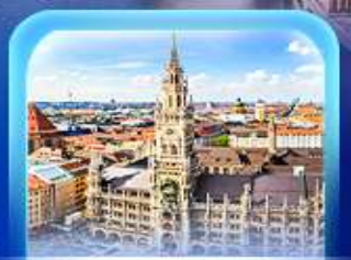
จัตุรัสมาเรียนพลัทซ์

เวียนนา ปราสาทนอยชวาสไตน์ ลูเซิร์น เซอร์แมท ชุก ซูริก