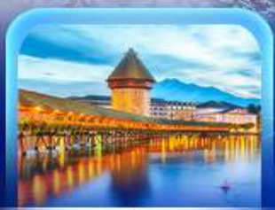
สะพานไมซ์าเปลา