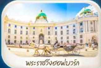
พระราชวังฮอฟบวร์ก