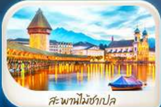
สะพานไมซ์าเปล