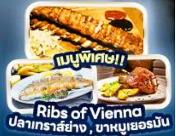
เมนูพิเศษ!! Ribs of Vienna ปลาเทราสย่าง, บาคูเยอร์มิน