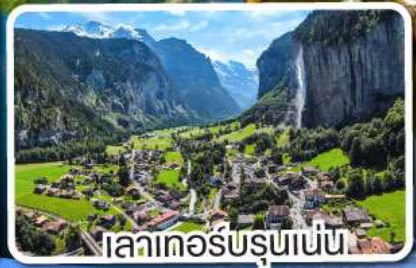
เลาเคอร์บรุนเนน