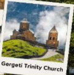
Gergeti Trinity Church