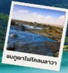
ชมภูเขาไฟโคลนลาวา